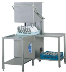
Lamber L24 ek