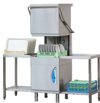
Lamber L25 ek