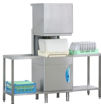
Lamber A410 ek