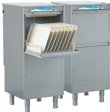
Lamber 01F ek