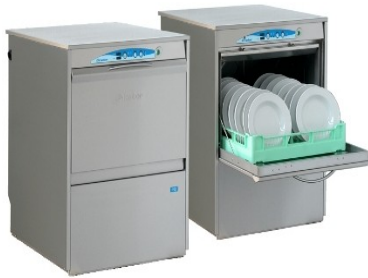
Lamber F92 ek