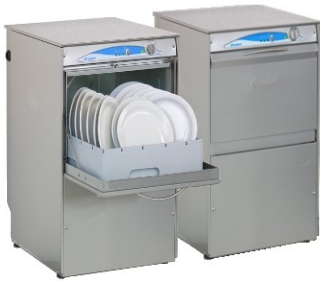
Lamber 045F ek