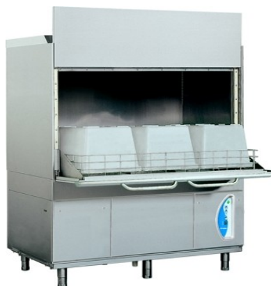
Lamber LP38 ek