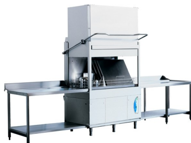
Lamber LT1500 ek