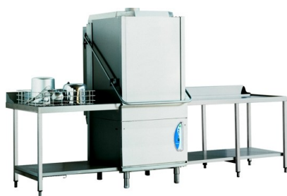
Lamber LT 850 ek