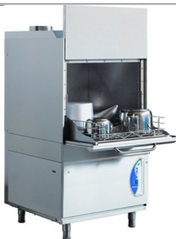
Lamber LP6 ek