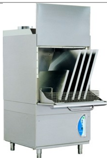
Lamber LP8 ek