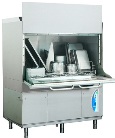
Lamber LP31 ek